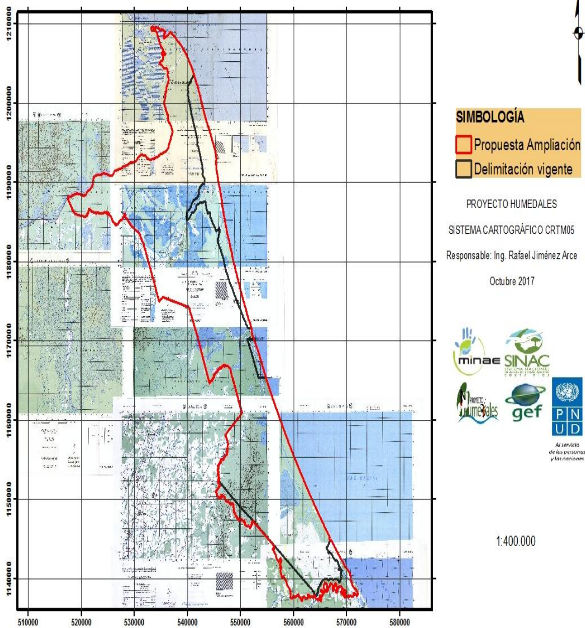
Figura 2. Antiguos límites del Humedal Ramsar Caribe Noreste y nuevos límites con la ampliación. Septiembre 2019.