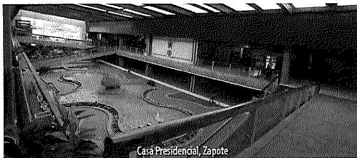
Casa Presidencial, Zapote