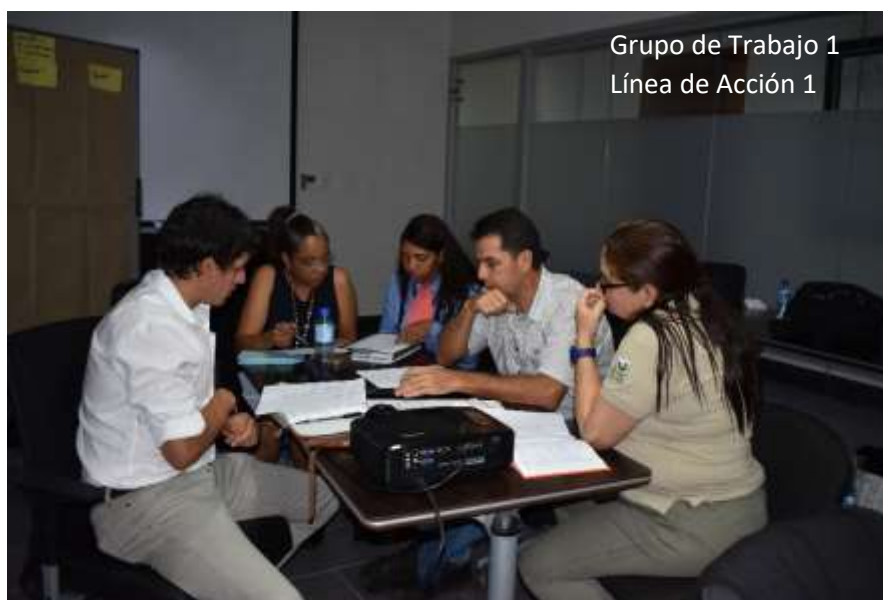
Grupo de Trabajo 1 Línea de Acción 1

En fotografías aprecia el resultado trabajo de grupos