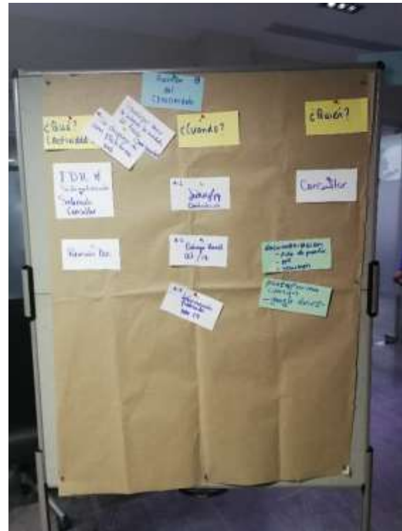
Resultado Grupo de Trabajo 3

En el Anexo 2 del presente informe, se presentan las 4 Líneas de Acción con sus respectivos resultados e indicadores. Estas tablas recogen las observaciones y sugerencias de cambio hechas por los grupos de trabajo de Costa Rica y del Ministerio de Medio Ambiente y Recursos Naturales de la República Dominicana, en reuniones previas y matrices enviadas a la consultora.