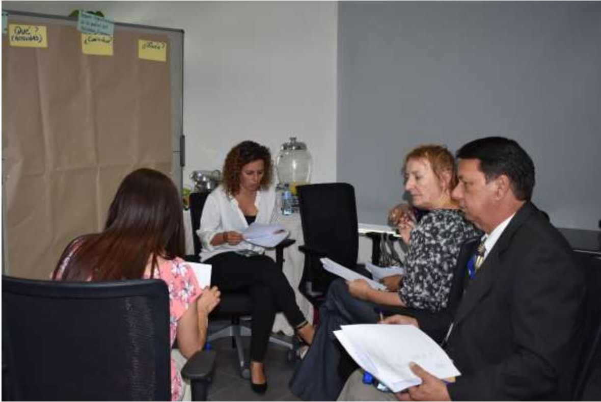
Resultado Grupo de trabajo 2