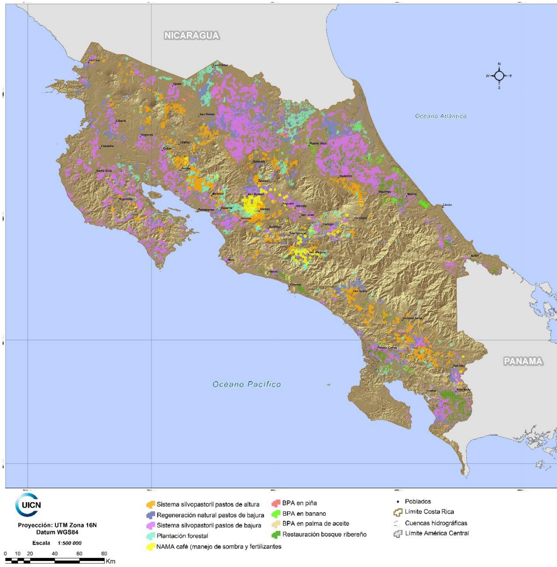
Figura 1 : Mapa de oportunidades de Rehabilitación de paisaje forestal en Costa Rica